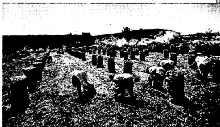
Aún son bajos los recursos que los productores reciben de la inversión pública en servicios agropecuarios.

tir del año 2008 el país inició, como resultado de los TLC (particularmente EE.UU.), una reducción significativa de su política de apoyo vía precios y una disminución sustancial de los aranceles.